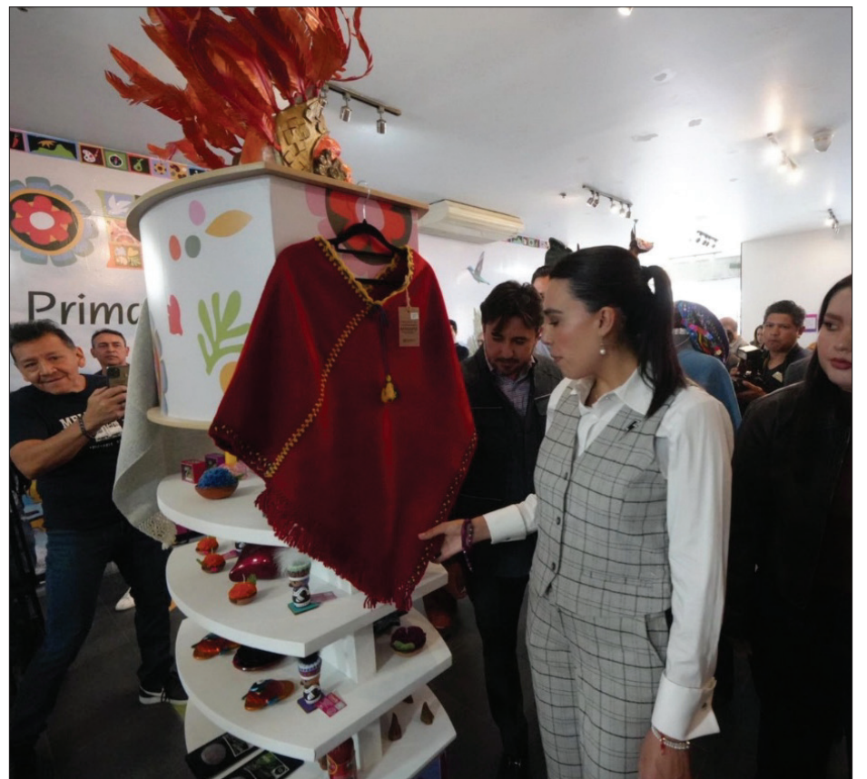
▲ La secretaria de Turismo del Gobierno de México, Josefina Rodríguez Zamora inauguró el espacio de Morelos en Punto México, una de las principales vitrinas nacionales para el sector.

La muestra incluye venta de artesanías a través de la tienda Tlalli, así como un mural interactivo para explorar los principales atractivos turísticos del estado. Además, se presenta una exposición en el Museo del Palacio Postal, donde se exhiben más de 500 piezas elaboradas por más de 40 artesanos provenientes de municipios como Amacuzac, Ayala, Cuautla, Cuernavaca, Hueyapan,