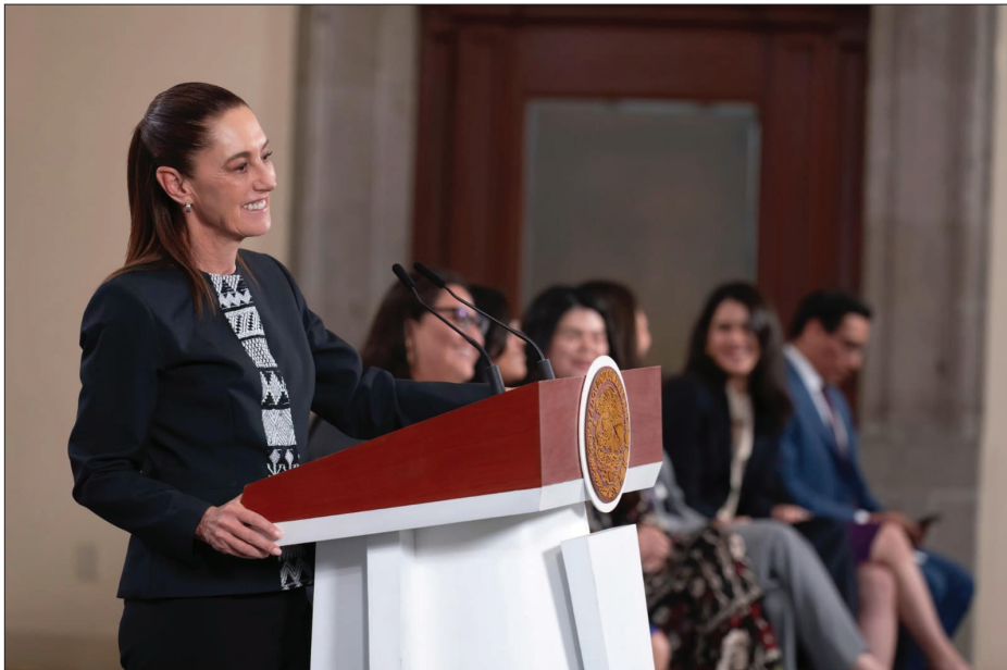
▲ La presidenta Claudia Sheinbaum Pardo presentó el primer acuerdo de colaboración con Google, Meta y TikTok para combatir la violencia digital contra las mujeres.