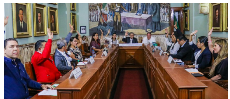
▲ El cabildo de Cuernavaca aprobó la reforma al Bando de Policía y Buen Gobierno con que se promueve la capacitación al personal municipal para evitar cualquier forma de discriminación.

El Ayuntamiento de Cuernavaca reafirma su compromiso de consolidar una ciudad donde la dignidad humana sea el eje de las políticas públicas, promoviendo una convivencia basada en el respeto, la igualdad y la inclusión.