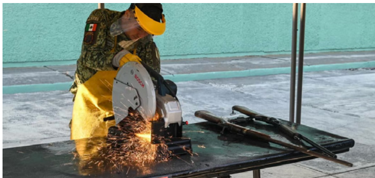
▲ Las 78 armas de fuego, 103 cargadores y más de 16 mil cartuchos de distintos calibres, y 188 kilogramos de drogas asegurados en operativos coordinados entre fuerzas federales, estatales y municipales fueron destruidos.

Además de la incineración de drogas, el acto incluyó la destrucción de 78 armas de fuego, 103 cargadores y más de 16 mil cartuchos de distintos calibres. Estos materiales fueron retirados de las calles como parte de los protocolos establecidos por el gobierno