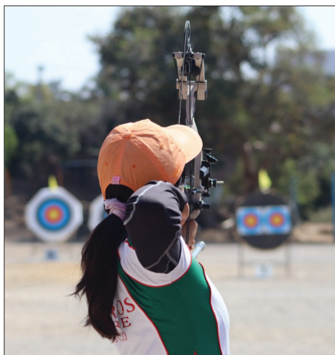
▲ El buen desempeño de los atletas morelenses logró la clasificación de cuatro arqueros más, con lo que la selección local para la Olimpiada Nacional tiene ya siete integrantes.

Morelos continúa consolidando su presencia en el tiro con arco rumbo a la Olimpiada Nacional 2026, luego de que cuatro arqueros más aseguraran su clasificación a la máxima justa deportiva juvenil del país durante el segundo control de ranking nacional, realizado en la capital de la entidad.