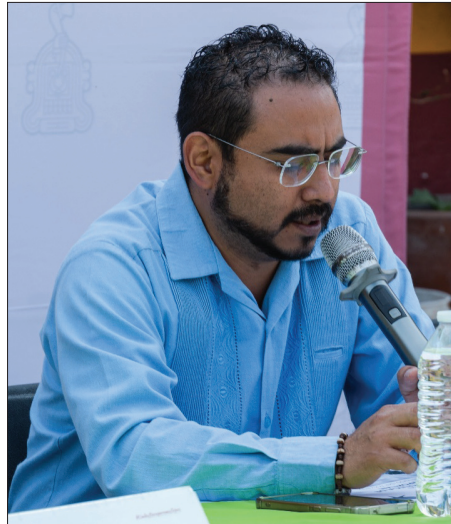
▲ El alcalde Perseo Quiroz Rendón presentó la Feria del Libro Tepoztlán que se celebrará del 19 al 22 de marzo en la plaza cívica.

proyectos comunitarios y una proyección especial de cine, en un programa que articula literatura, memoria, ciencia, medio ambiente, derechos humanos y cultura local.