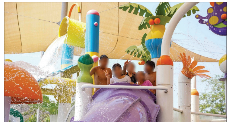
▲ Con la firma del convenio, la niñez de comunidades con alto grado de marginación y vulnerabilidad podrá visitar el parque de la zona sur de Morelos con el apoyo del sistema DIF estatal.

Durante 2025 esta colaboración permitió que más de 500 niñas y niños visitaran el parque, provenientes de municipios como Totolapan, Hui-